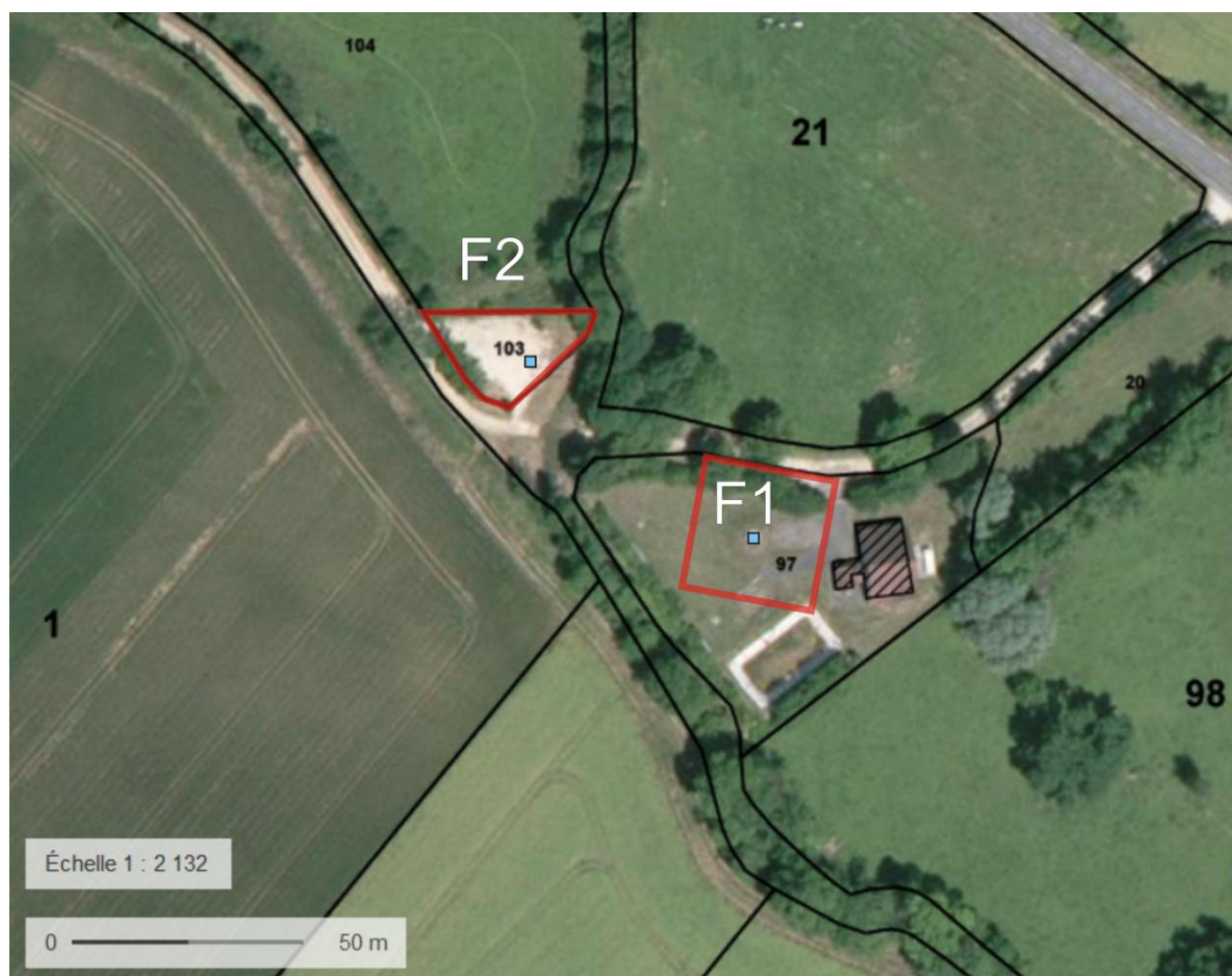
Figure 1 : PPI F1 et F2.

Le périmètre de protection immédiate du forage F1 est conservé (proposé le 24 Avril 1994 par S. BONNION, hydrogéologue agréé en matière d'hygiène publique pour le département de l'Yonne).